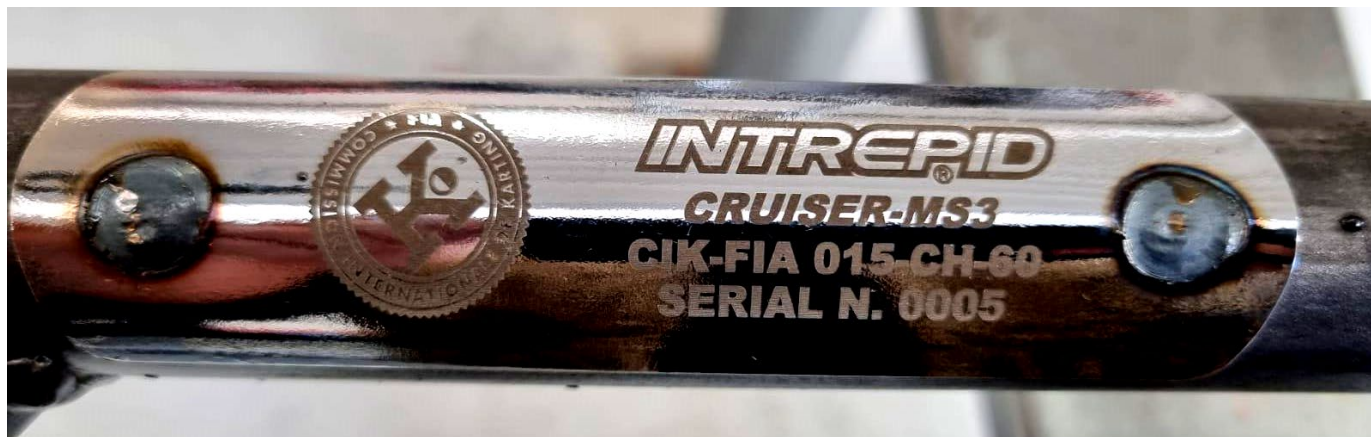
Photo du marquage du numéro d'homologation / Photo of the homologation number marking

Le marquage indiqué sur le tube transversal arrière doit rester clairement visible en permanence. / The marking located on the rear strut must be clearly visible at all times.