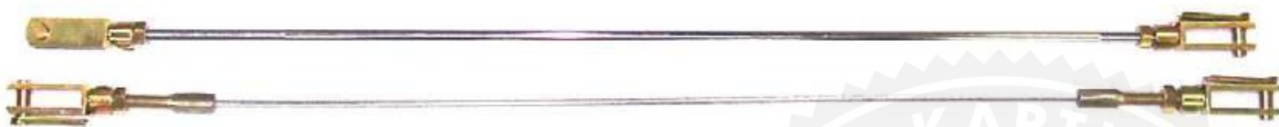
Photo du câble de la commande de freinage / Photo of brake control cable

La commande de freinage doit être isolée du châssis et montrer la double commande. / The brake control must be separated from the chassis and the double linkage must be shown.