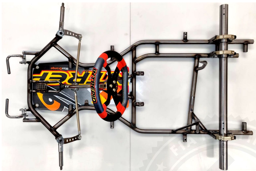
Photo du dessus du châssis complet identique à l'un des modèles présentés à l'homologation sans pare-chocs, freins, carrosserie, siège ni pneumatiques Photo from above of complete chassis identical to one of the models submitted for homologation without bumpers, brakes, bodywork, seat or tyres.

Signature et tampon de l'ASN / Signature and stamp of the ASN