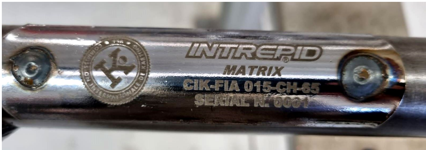
Photo du marquage du numéro d'homologation / Photo of the homologation number marking

Le marquage indiqué sur le tube transversal arrière doit rester clairement visible en permanence. / The marking located on the rear strut must be clearly visible at all times.